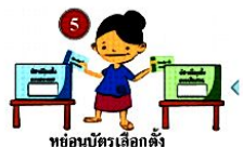
หย่อนบัตรเลือกตั้ง